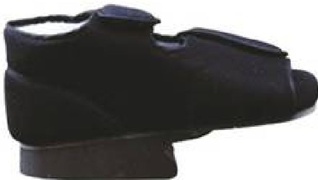
Sandália pós operatória tipo Barouk

A técnica utilizada atualmente inclui o uso de materiais especiais de fixação óssea. Isso, somado à agressividade reduzida do procedimento permite que o paciente apóie o pé no solo logo após a cirurgia. Para permitir a caminhada de maneira mais adequada, um tipo especial de órtese é utilizado, como mostra a figura.